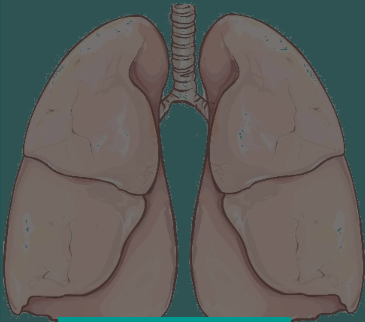
Πνεύμονες μη καπνιστή